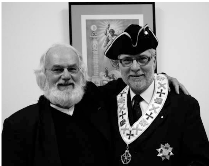
El autor y el traductor en la festividad de la San Andrés 2012 del G.P.D.H.